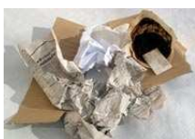
Mars de café